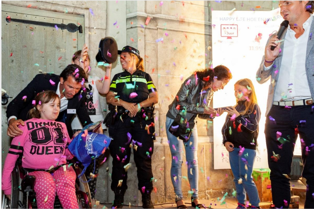
Lancering van Happy Life met Pieter van den Hoogenband en bekendmaking eerste rollen Van links naar rechts: Wijkmanager, Politieagent, Wethouder (ontbrekend op de foto: Burgemeester)